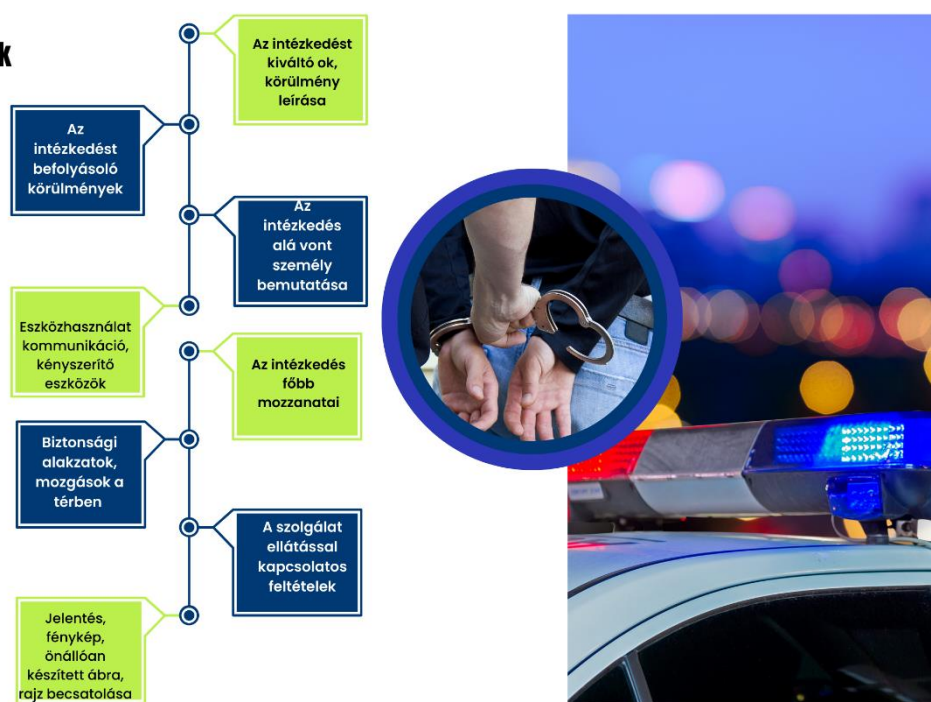
6. számú ábra: Intézkedés felépítése